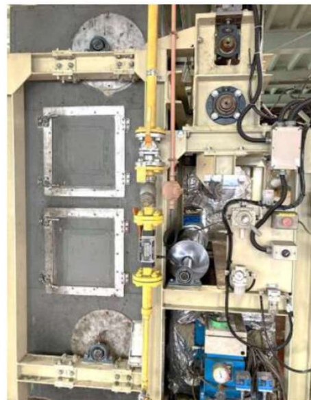
既設の蒸気配管、ドレン、給水、排水管に接続、乾燥炉の中のターンロールと入口ガイドロールも交換し完成。