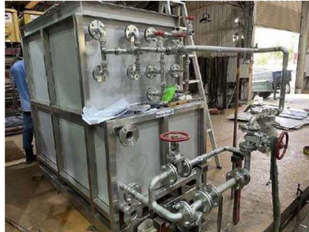
脱脂槽、水洗槽と写っていない湯洗槽の更新です。エバラ製ポンプは国内手配の為、ダミーパイプです。