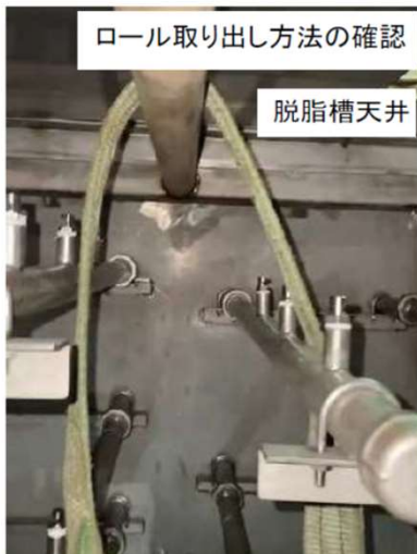
ロール取り出し方法の確認