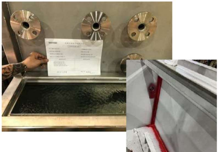
各水槽の漏れ検査