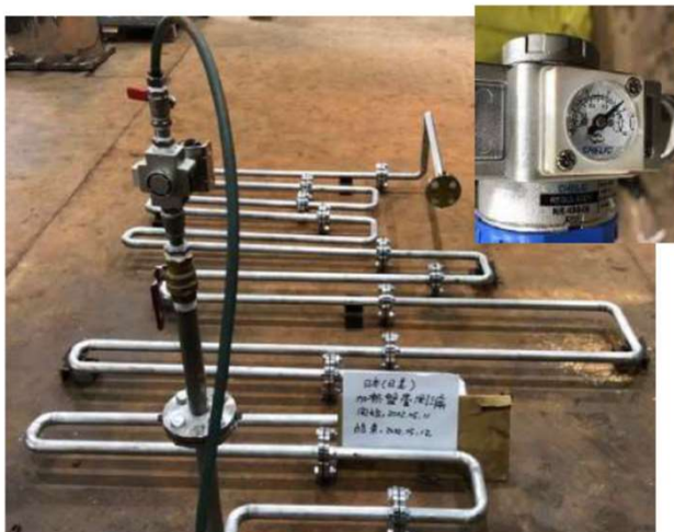
蒸気用蛇管の漏れ検査