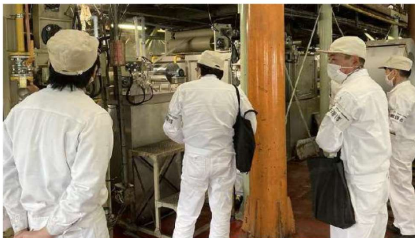
安全審査にも合格し、設備検収合格。