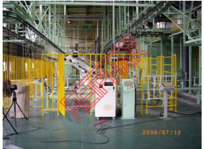
移載ロボット及びフローコンベア