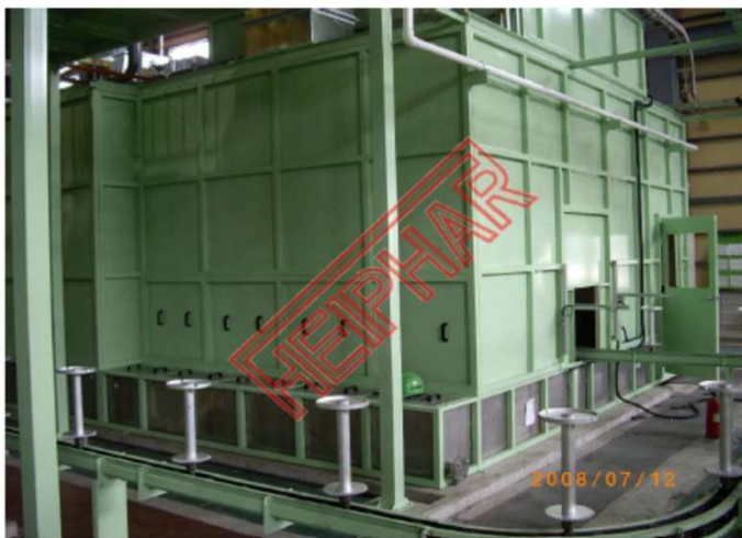
塗装ブース裏側及びフローコンベア(接液部SUS304) オールSUS304での製作も当然可能です。