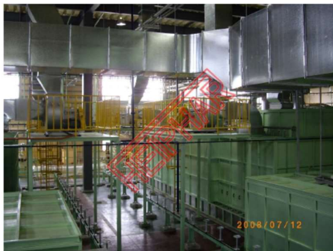
塗装乾室裏側と排気ファン及び排気ダクト関係