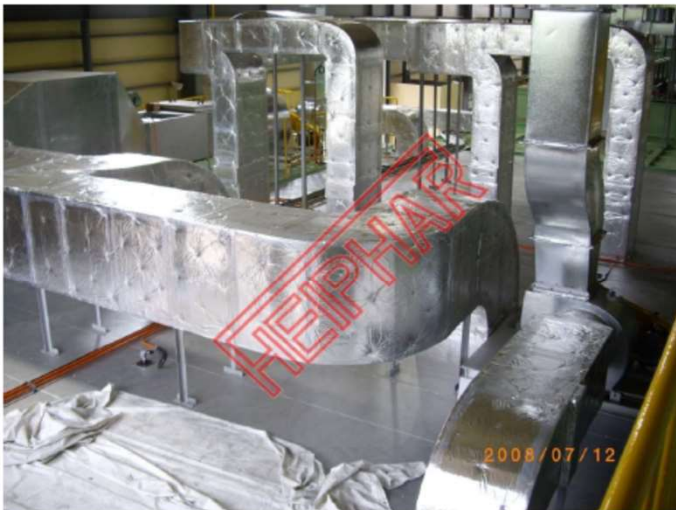
塗装乾燥炉の上部のダクト及び排気ファン