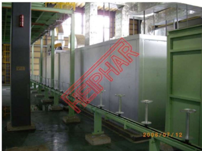
手前セッティング室、奥側塗装乾燥炉