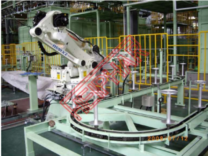
移載ロボット及びフローコンベア